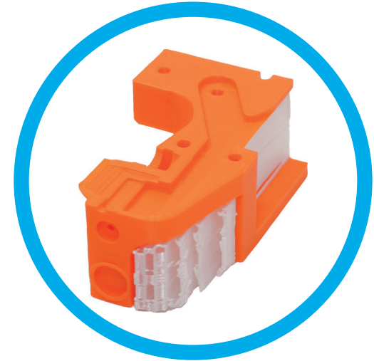
material de soporte dedicado...