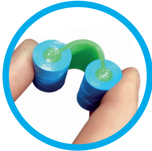
imprime con diferentes materiales...